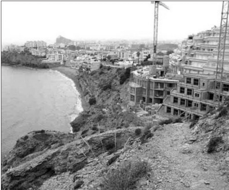
Figura 4 VIVIENDAS EN CONSTRUCCIÓN EN EL ACANTILADO DE LA PLAYA DE EL HORNILLO. OCTUBRE DE 2008.

De los municipios del litoral murciano, el de Águilas ha sido el que menos ha desarrollado la actividad turística, debido a que ha centrado su economía en la agricultura y la pesca. No por ello ha quedado al margen del proceso turístico urbanizador que ha afectado al Arco Mediterráneo durante la primera década de este siglo, y que se refleja en la cantidad de viviendas construidas, preferentemente destinadas a segunda residencia (Figura 4).