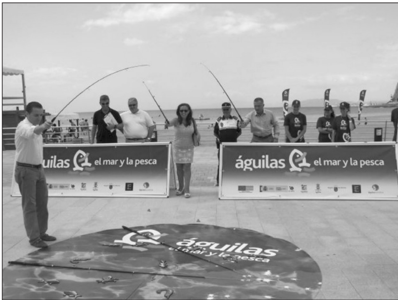
Figura 5 CAMPAÑA PROMOCIONAL DEL PLAN DE COMPETITIVIDAD TURÍSTICA ÁGUILAS, EL MAR Y LA PESCA. VERANO DE 2011

playas y paseos marítimos del municipio, para ello se han habilitado espacios tematizados para el desarrollo de distintas actividades y divertidos juegos, en los que los bañistas han conseguido alguno de los miles de regalos directos incluidos en la campaña (Figura 5).