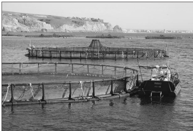
Figura 3 PISCIFACTORÍA PARA EL CULTIVO DE DORADA Y LUBINA. PUNTA PARDA. ÁGUILAS. AÑO 2010