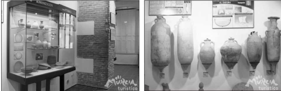
Figura 1 MUSEO ARQUEOLÓGICO Y CENTRO DE INTERPRETACIÓN DEL MAR DE ÁGUILAS